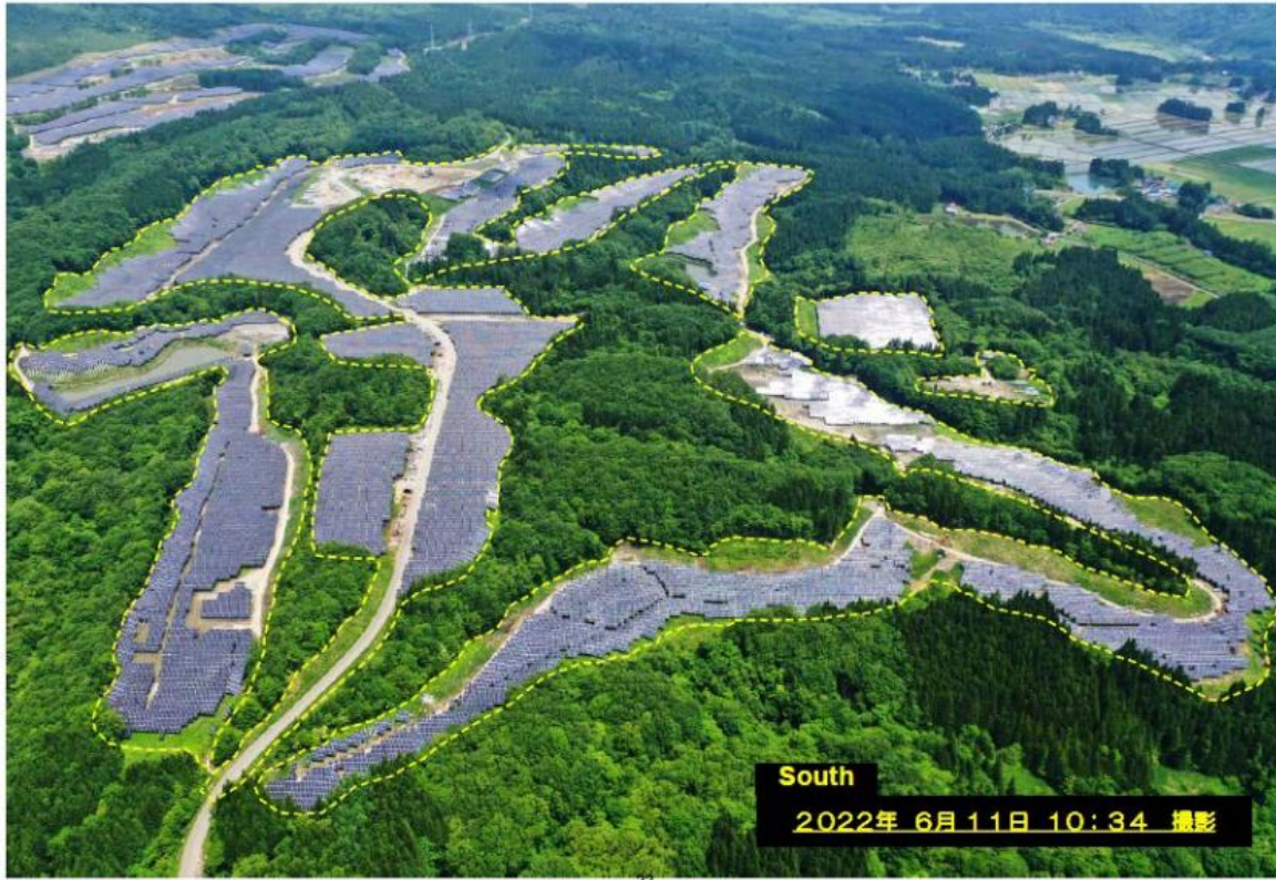
Fig 4: Onikoube on Progress with 82% Completion as of 2Q22