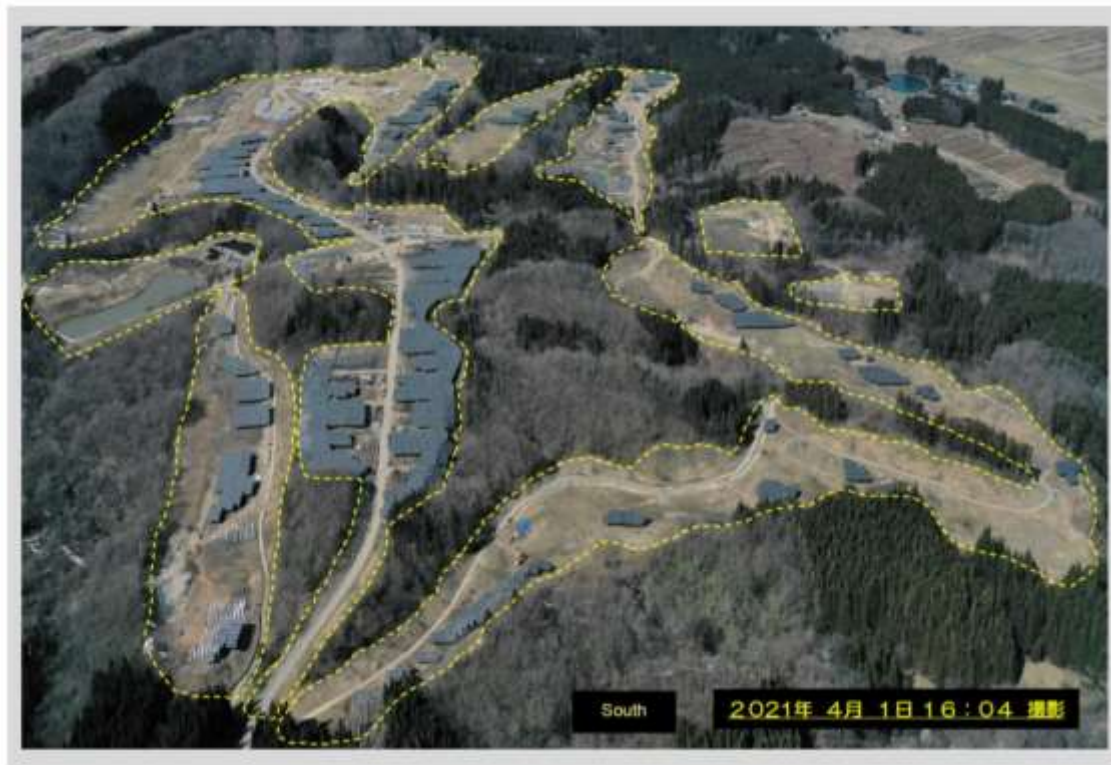
Figure 3: Onikoube project update